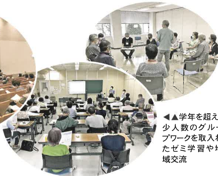
◀▲学年を超え、少人数のグループワークを取入れたゼミ学習や地域交流