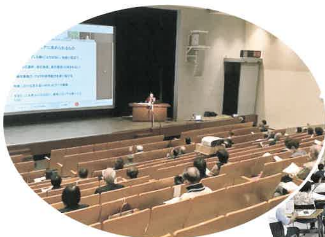
▲小ホールでの講義。ソーシャルディスタンスをとり、オンライン併用で実施